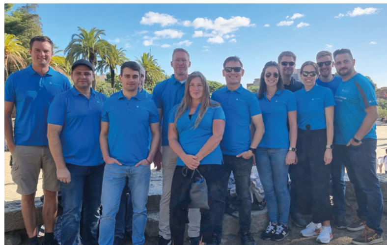
Ausflug unseres Consulting-Teams nach Barcelona

Sonstiges: Küche, kostenloser Kaffee, 2x pro Woche interne Köchin, kostenfreies Wasser, Feierabendbier mit den Kollegen, Betriebliche Gesundheitsvorsorge