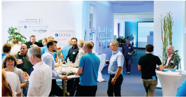
Über 100 Gäste befassten sich bei „intex“ mit dem Thema „Purchase-to-Pay“.

HAUSMESSE Wetzendorfer Unternehmen lud ein.